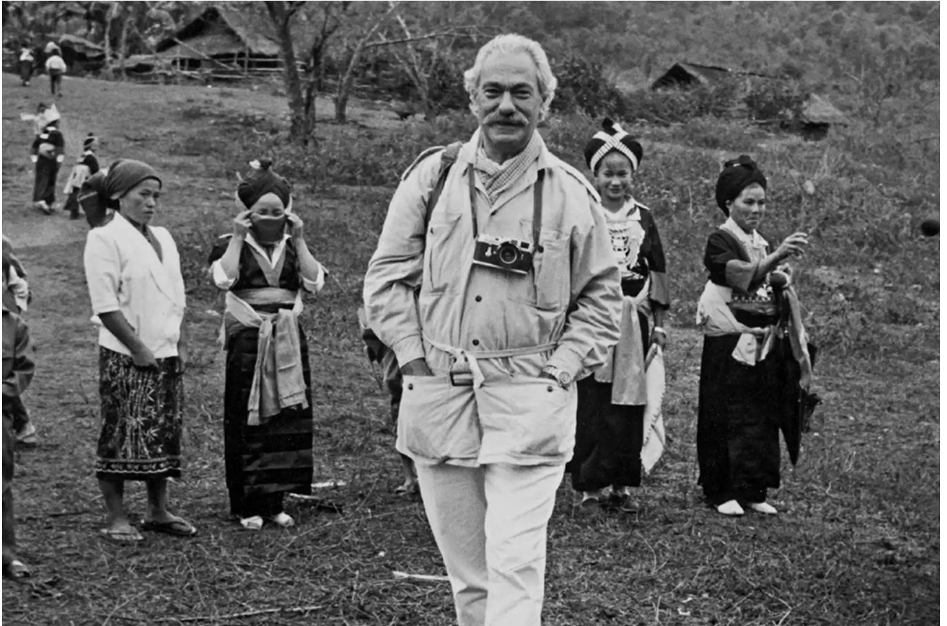
In foto: Tiziano Terzani.

Questa comprensione è importantissima e assolutamente attuale. Perché a partire dalla fine del comunismo negli anni '90, il sistema economico-scientifico-tecnologico a guida occidentale, è sentito autorizzato a espandersi in tutto il mondo e a non lasciare un lembo di terra fuori dalla sua superiore sfera, oggi più che mai. È la stessa legge dell'economia che lo impone: quella della crescita infinita. Ma questo non fa che portare alla guerra, alla guerra infinita. «La guerra - scriveva Terzani nel novembre 2001 - si sposterà verosimilmente in Iraq, in Somalia, in Sudan, forse in Siria, in Libano e chi sa dove ancora. Sono più di sessanta gli stati in cui secondo Washington si annidano i terroristi e chi non collaborerà con gli Stati Uniti a snidarli sarà considerato un nemico».