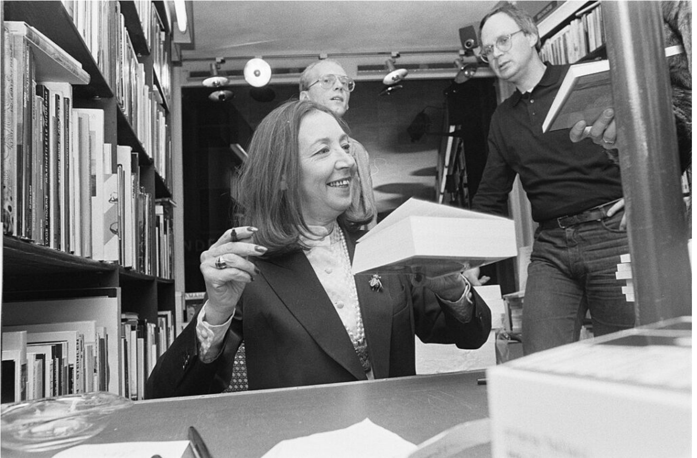
La giornalista e scrittrice Oriana Fallaci

Per tutta la sua vita di giornalista, Terzani aveva cercato di capire le ragioni degli Altri. In Vietnam, in Cambogia, in Cina, in Giappone, aveva scandagliato le ragioni di quei popoli che, avendo subito la colonizzazione, cercavano di reagire all'impatto con la modernità occidentale. L'attacco al World Trade Center per lui era il segno definitivo che l'America non poteva più illudersi di stare esportando nel mondo benessere e giustizia. Al contrario, larga parte del mondo vedeva nella globalizzazione a guida statunitense, ovvero alla economicizzazione del mondo, un gravissimo pericolo da combattere , anche al costo della propria vita.