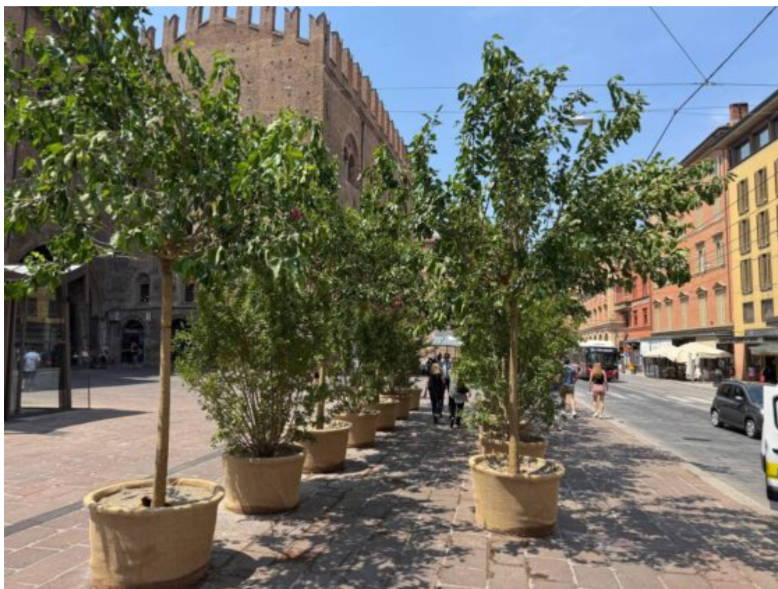
Alberelli collocati in via Rizzoli

Il sindaco di Bologna risponde a L'Indipendente, ma la toppa è peggiore del buco