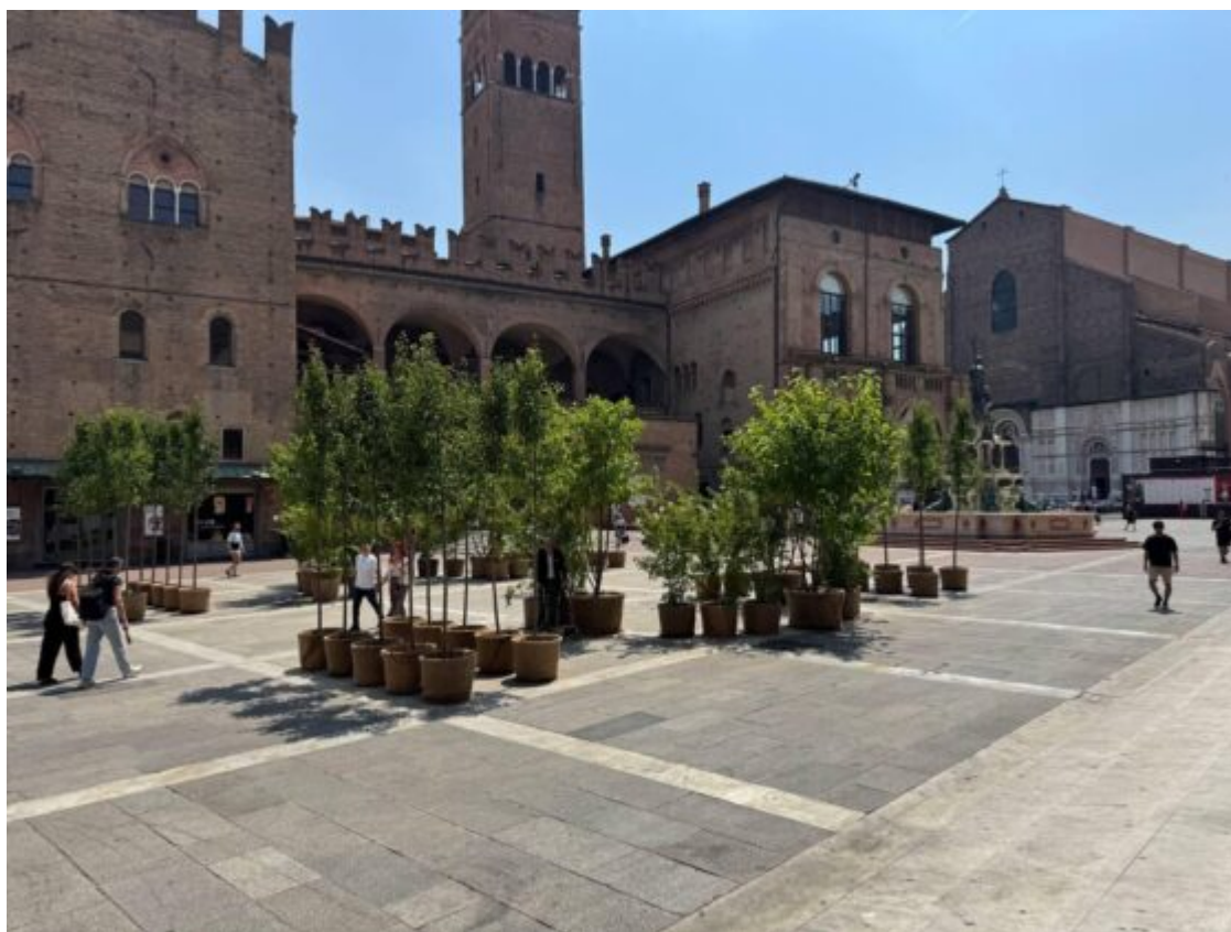
Alberelli collocati in piazza Nettuno

Il sindaco di Bologna risponde a L'Indipendente, ma la toppa è peggiore del buco