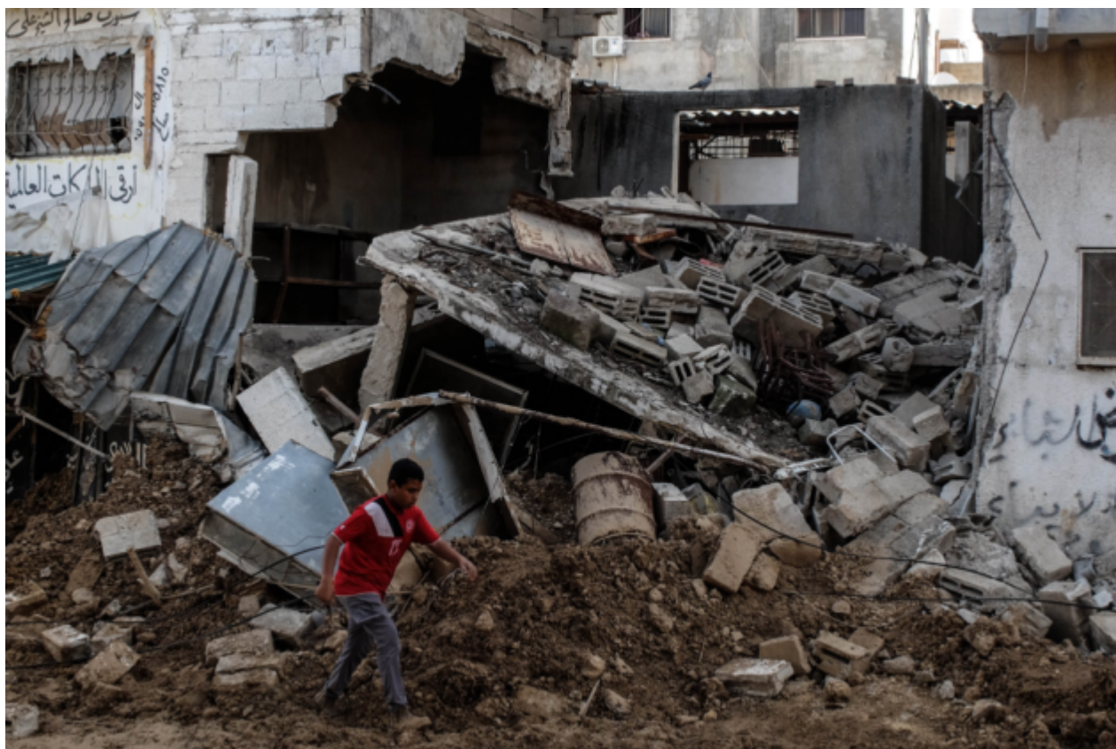
Casa demolita dalle bombe israeliane, Tulkarem Refugee Camp

Israele demolisce interi quartieri in Cisgiordania: oltre 40.000 sfollati in tre settimane