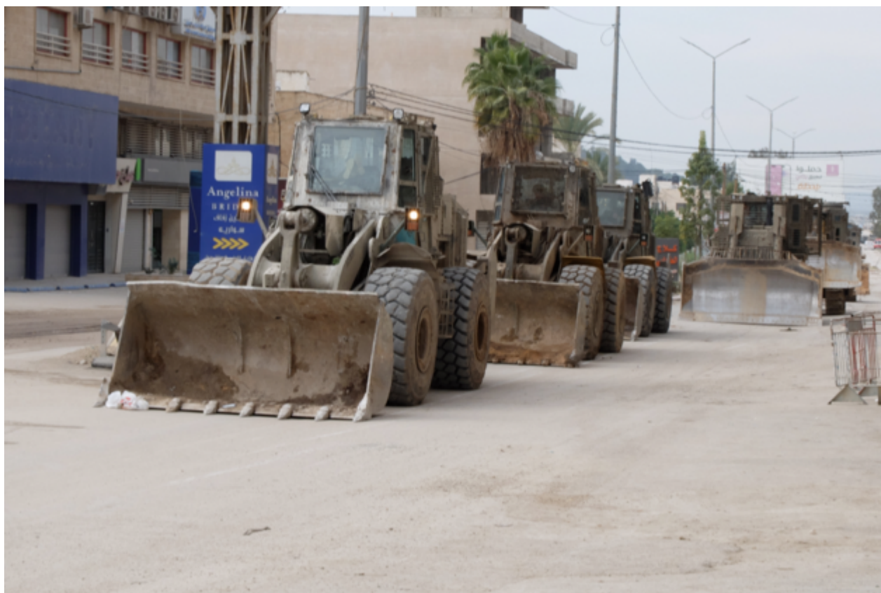
L'assedio di Jenin in seguito all'inizio dell'operazione "Muro di ferro"

Israele demolisce interi quartieri in Cisgiordania: oltre 40.000 sfollati in tre settimane