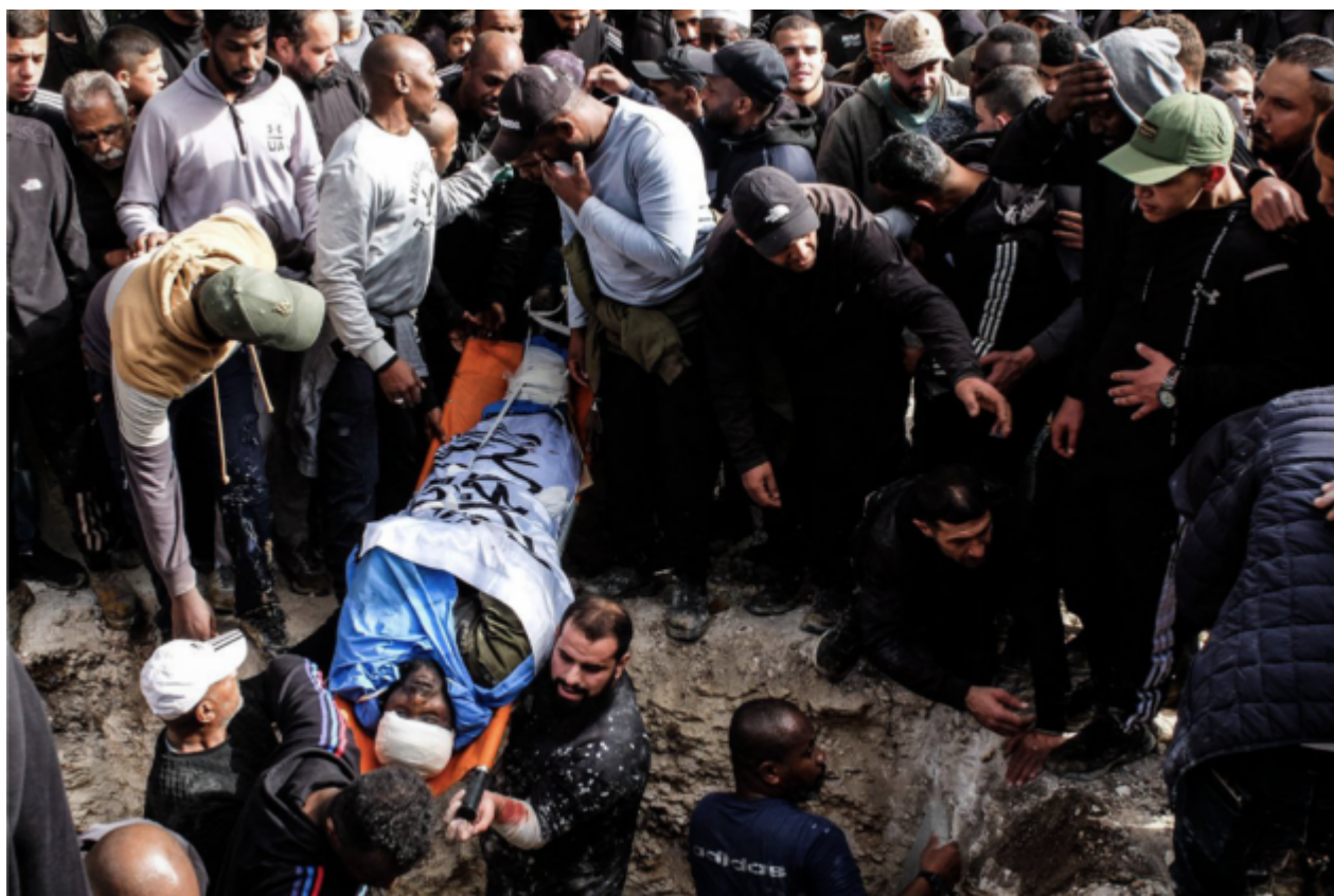
Interramento di uno dei corpi dei martiri, Tulkarem Refugee Camp. 26 dicembre 2024

Israele demolisce interi quartieri in Cisgiordania: oltre 40.000 sfollati in tre settimane