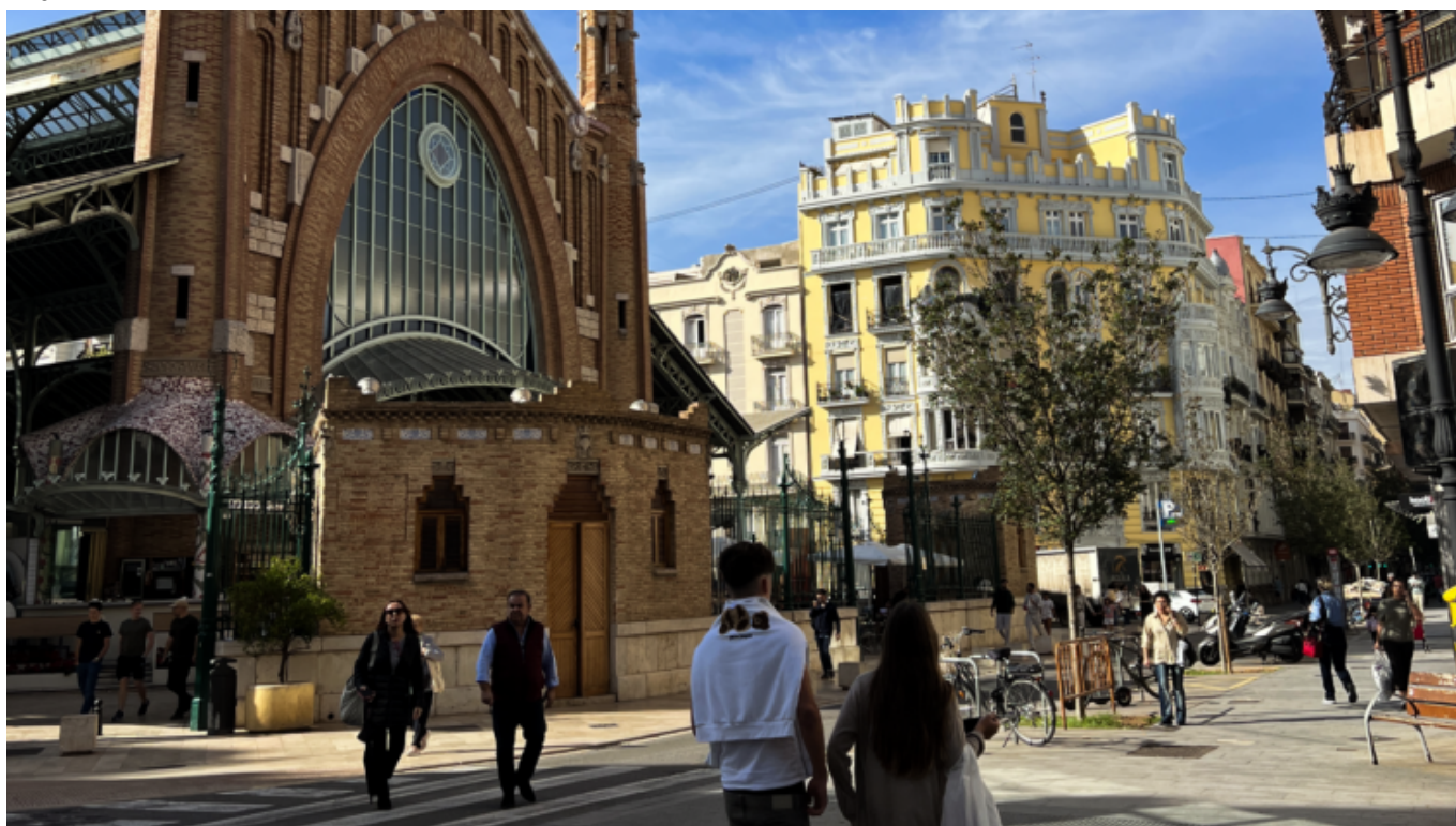
Marcat de Colon altra zona storica in città [Valencia, 31 ottobre 2024]