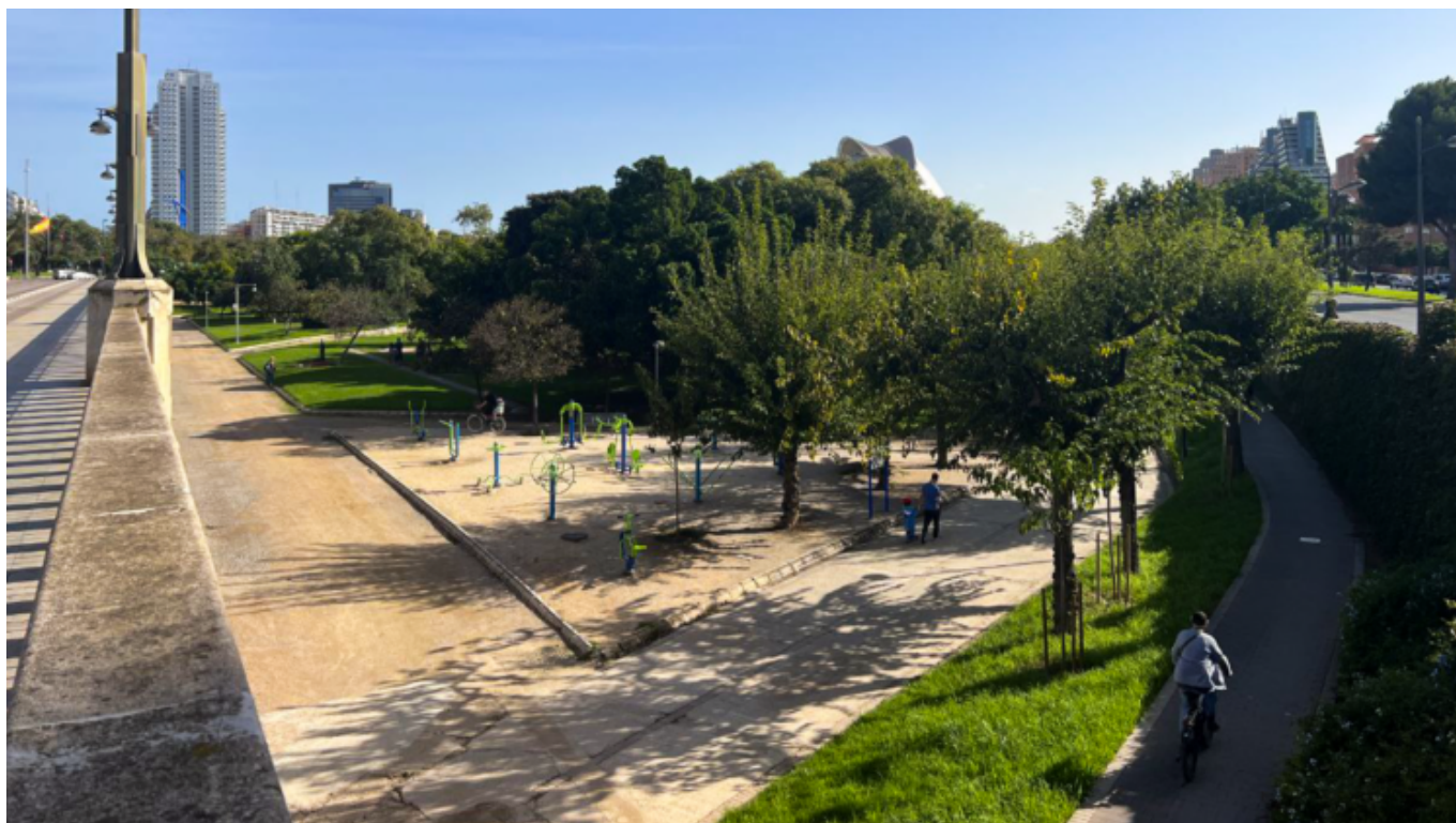
Vista sul parco Turia [Valencia, 31 Ottobre]