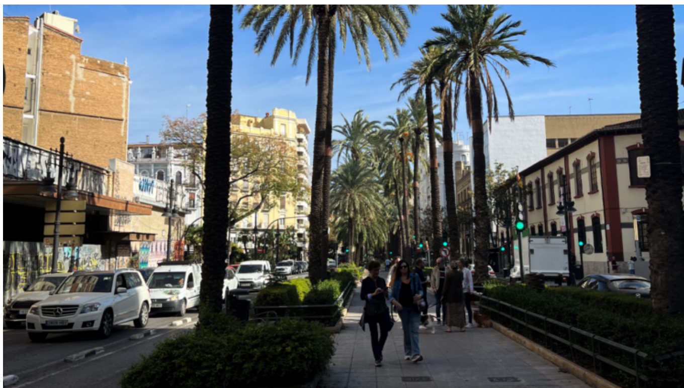
La Gran Via , una delle zone più centrali e frequentate della città [Valencia, 31 ottobre]

La situazione a Valencia è piuttosto diversa da come viene raccontata sui media