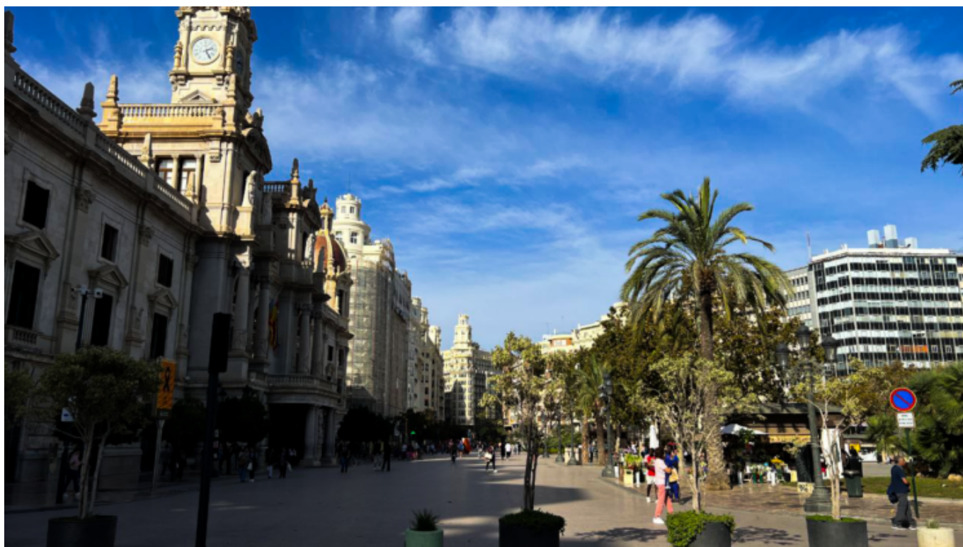
Plaza de l'Ajuntament, centro turistico e amministrativo della città [Valencia, 31 ottobre 2024]

La situazione a Valencia è piuttosto diversa da come viene raccontata sui media