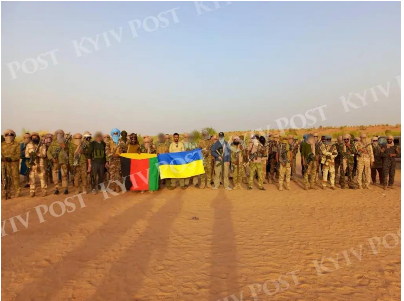
La foto dei ribelli Tuareg con la bandiera ucraina pubblicata dal Kyiv Post

Sabato 27 luglio, in Mali, i ribelli Tuareg avrebbero ucciso un numero imprecisato di combattenti della compagnia militare russa Wagner in una cruenta battaglia nel deserto al confine con l'Algeria, nel distretto di Tinzaouatene. Capire se quella inflitta ai russi sia realmente la carneficina descritta è impossibile, dato che la fonte è un quotidiano ucraino: il Kyiv Post. Tuttavia, che l'imboscata sia avvenuta e che vi siano state vittime e catture di ostaggi è testimoniato da diversi video. I Tuareg si sono fatti fotografare festanti con una bandiera ucraina, mentre Andrii Yusov, della Direzione principale dell'intelligence ucraina (GUR), ha affermato che le forze ucraine hanno dato sostegno operativo e di intelligence all'operazione Tuareg. Non è l'unico caso: quello che sta emergendo è che l'Africa sta diventando un nuovo tassello della guerra in corso tra Russia e Ucraina o, per meglio dire, tra Russia e Occidente.