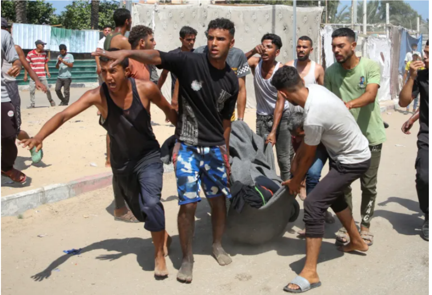
Alcuni uomini trasportano una vittima degli attacchi israeliani ad al-Mawasi

L'ultima strage israeliana: almeno 90 civili ammazzati per stanare (forse) un capo di Hamas