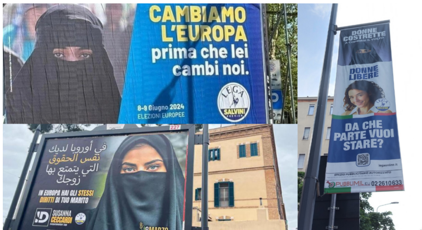
Alcuni dei manifesti affissi dalla Lega nel corso della campagna elettorale.

Allo stesso modo ha fatto discutere l'ultima uscita di Roberto Vannacci, il capolista della Lega nel centro e al sud divenuto famoso negli ultimi mesi per la pubblicazione del libro "Il mondo al contrario". In vista del voto dell'8 e 9 giugno Vannacci, di recente apparso sui profili social del Carroccio nelle vesti del gladiatore di Russell Crowe, ha invitato gli elettori a «fare una Decima sul simbolo della Lega e a scrivere Vannacci» per «travolgerli tutti con una valanga di voti». Le opposizioni sono prontamente insorte, accusandolo di rievocare la Xª Flottiglia MAS , un corpo militare italiano che dal 1943 al 1945 ha operato al fianco della Germania Nazista.