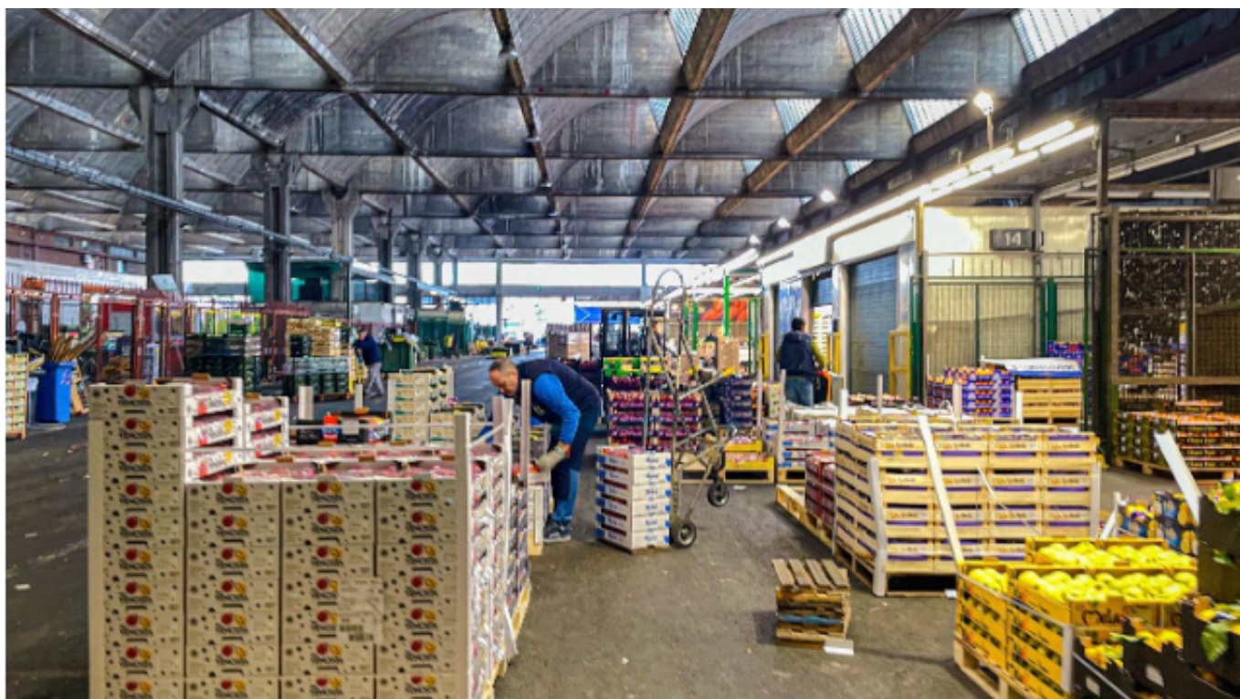
Pile accatastate di cibo in avanzo all'interno dell'Ortomercato di Milano

Il mercato è aperto tutti i giorni per la contrattazione e la vendita durante la mattina, dalle ore 5.00 alle 10.00; già lungo la via che porta all'edificio si incontrano numerosi venditori al dettaglio, che, terminato l'acquisto, percorrono a piedi con ingombranti carrelli il percorso che li porta verso i banconi delle proprie attività commerciali. Ma è verso le ultime ore del mattino che è possibile osservare l'enorme quantità di cibo invenduto, accatastato in alte pile agli angoli delle piazzole interne, destinata alla spazzatura; è in questo momento che entra in gioco RECUP .