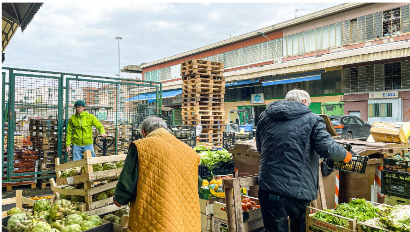
Cassette di cibo già smistato di fronte alla postazione di Recup

circuito di welfare aziendale e a ricevere così finanziamenti per la propria attività, insieme alla partecipazione a bandi di concorso, alle donazioni del 5×1000 e alla creazione di un progetto di fundraising e merchandising .