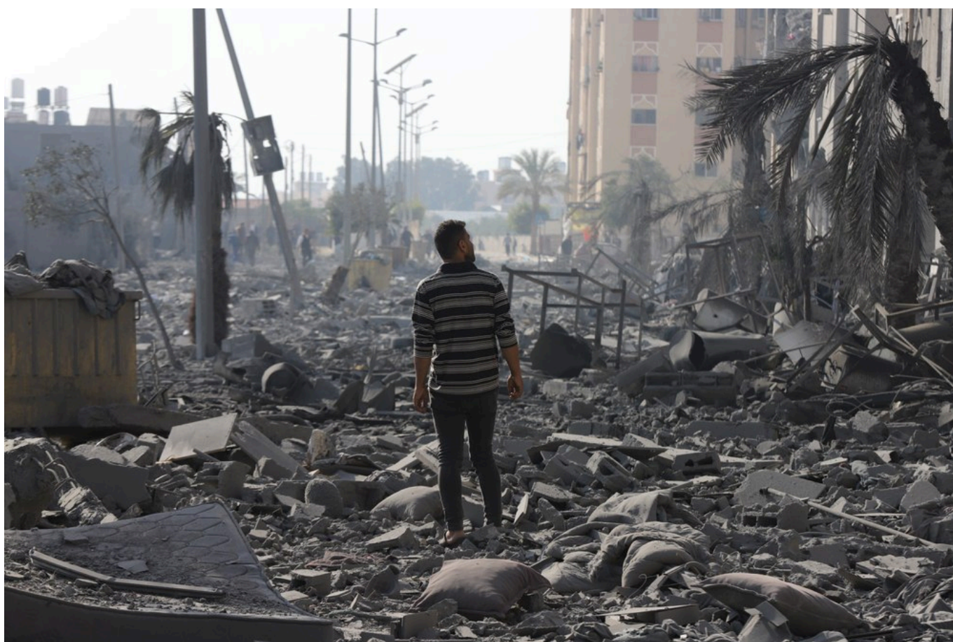
Un uomo cammina tra le macerie di Khan Yunis

primari”. L'autore scrive che “i due obiettivi principali dell'operazione Khan Yunis non sono stati raggiunti. I due massimi funzionari di Hamas a Gaza, Yahya Sinwar e Mohammed Deif, rimangono latitanti. E non si è verificato alcun progresso nel salvataggio degli ostaggi israeliani tenuti a Gaza”. In modo ancora più esplicito, scrive nero su bianco che “l'enorme morte e distruzione che l'IDF sta lasciando a Gaza, insieme ad alcune perdite da parte nostra, non ci stanno attualmente avvicinando al raggiungimento degli obiettivi della guerra. Le capacità militari e governative di Hamas vengono gradualmente degradate, ma l'organizzazione non è vicina alla sconfitta ”.