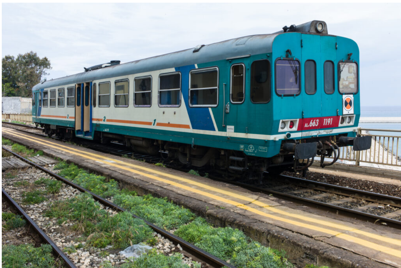
Treno delle Ferrovie dello Stato in Sicilia.

L'incidente in Calabria fa scattare la rabbia dei ferrovieri: è sciopero nazionale