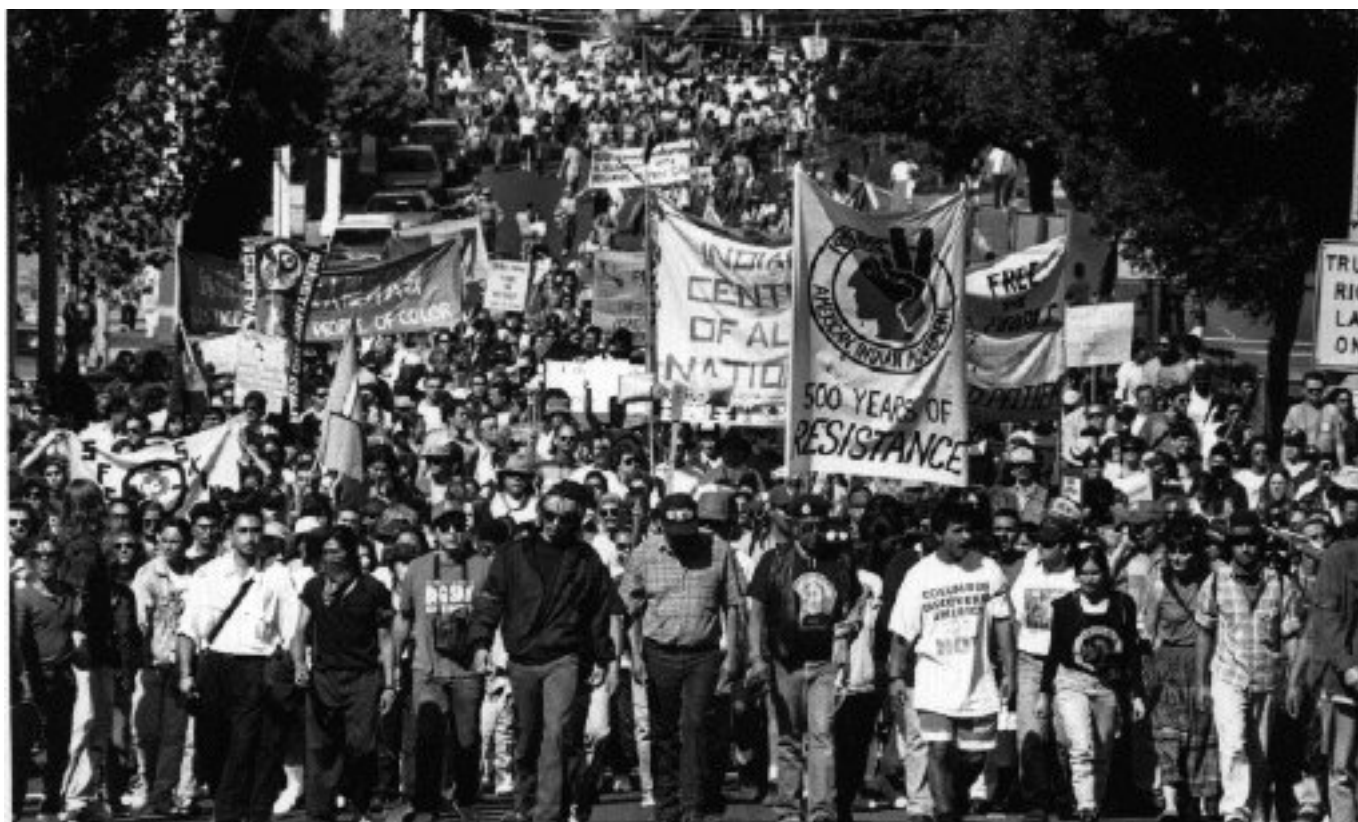
Marcia di protesta dei nativi americani entra a Washington DC, Stati Uniti, 1978.