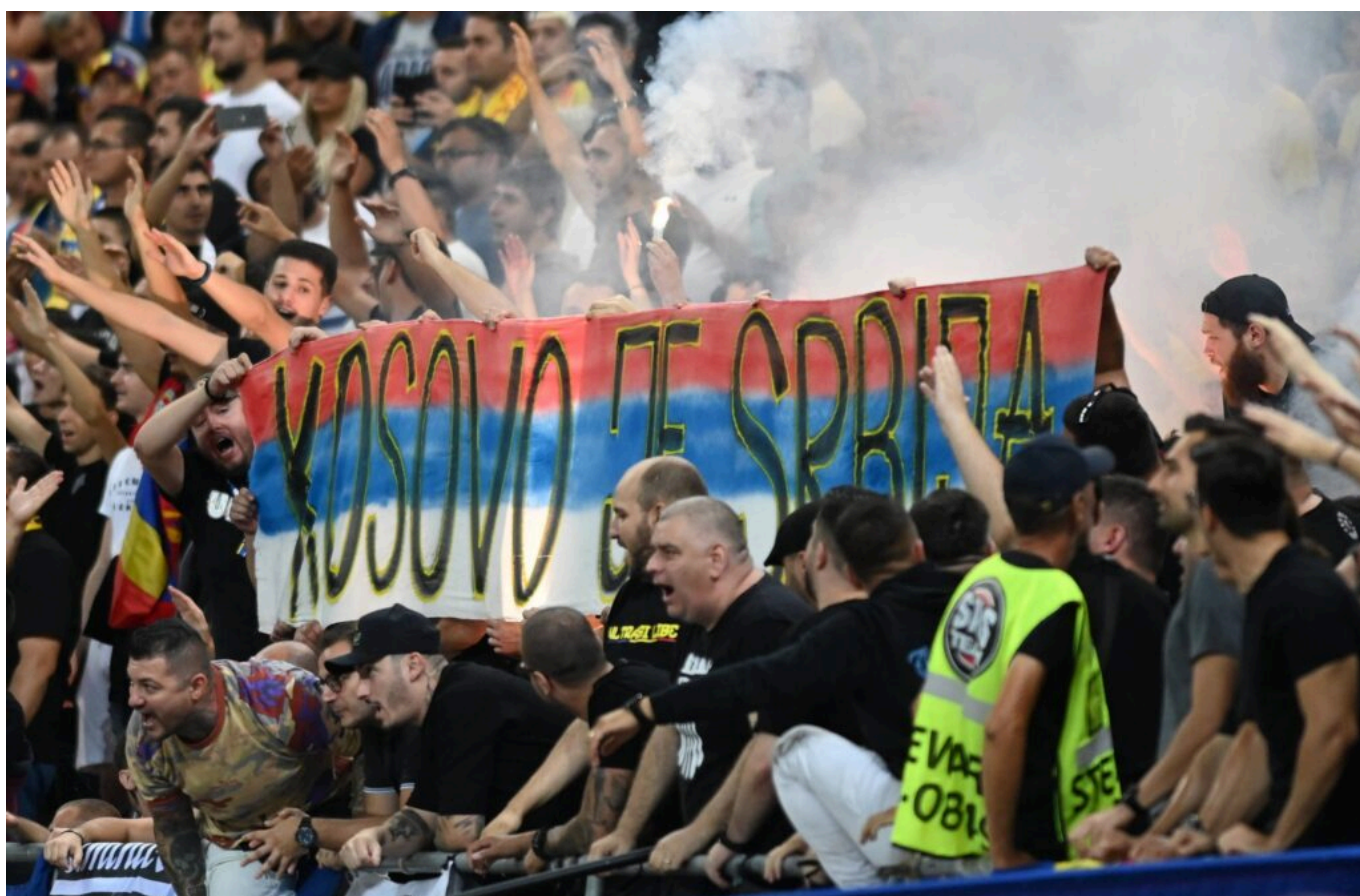
Tifosi romeni espongono striscione con scritto "Kosovo è Serbia".

La partita di calcio tra Romania e Kosovo, giocatasi martedì sera all'Arena Nazionale di Bucarest, era appena iniziata da un quarto d'ora quando l'arbitro ha deciso di richiamare i giocatori negli spogliatoi, sospendendo il match per circa 45 minuti. La causa? I cori e gli striscioni realizzati dai padroni di casa, che hanno portato la politica sugli spalti esibendo scritte eloquenti, come "Bessarabia è Romania" e "Kosovo è Serbia". Per capirne il legame è necessario tornare al 17 febbraio 2008, quando Pristina proclamò unilateralmente l'indipendenza da Belgrado . La Romania, così come Spagna, Cipro, Grecia e Slovacchia, si rifiutò di riconoscere tale cambiamento nello status quo, preoccupata dalle istanze di autonomia avanzate dalla minoranza magiara. Inoltre, facendo leva su questa interpretazione del principio di integrità territoriale, Bucarest non ha abbandonato le rivendicazioni sulla Bessarabia , regione sotto il controllo di Bucarest tra le due guerre mondiali e oggi coincidente in gran parte con la Moldavia. A fare da sfondo ai cori pro-Belgrado inscenati martedì sera è, infine, la questione religiosa, con Romania e Serbia accomunate dalla fede ortodossa.