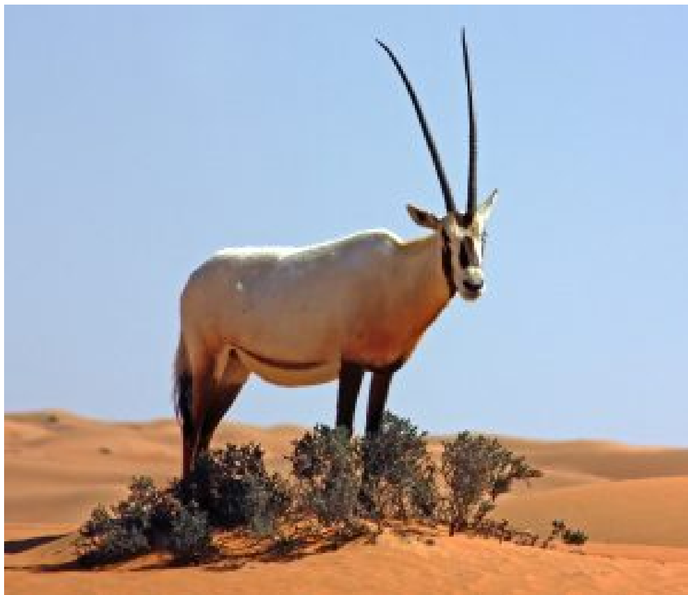
L'Orice di Arabia

L'Italia sarà ai mondiali in Qatar, con 560 soldati a disposizione dell'emiro