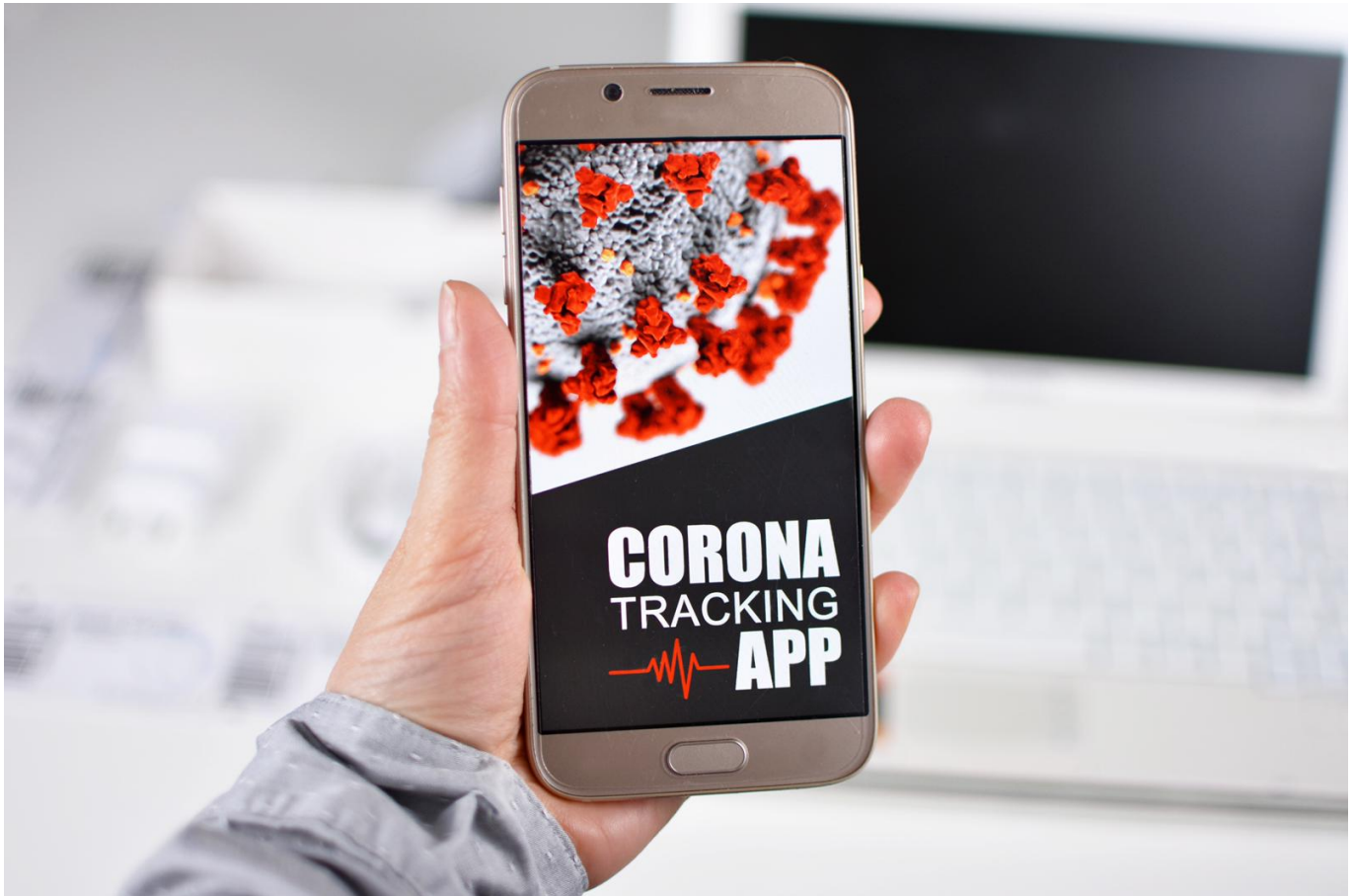
[Esempio di un'applicazione di rintracciamento Covid-19]