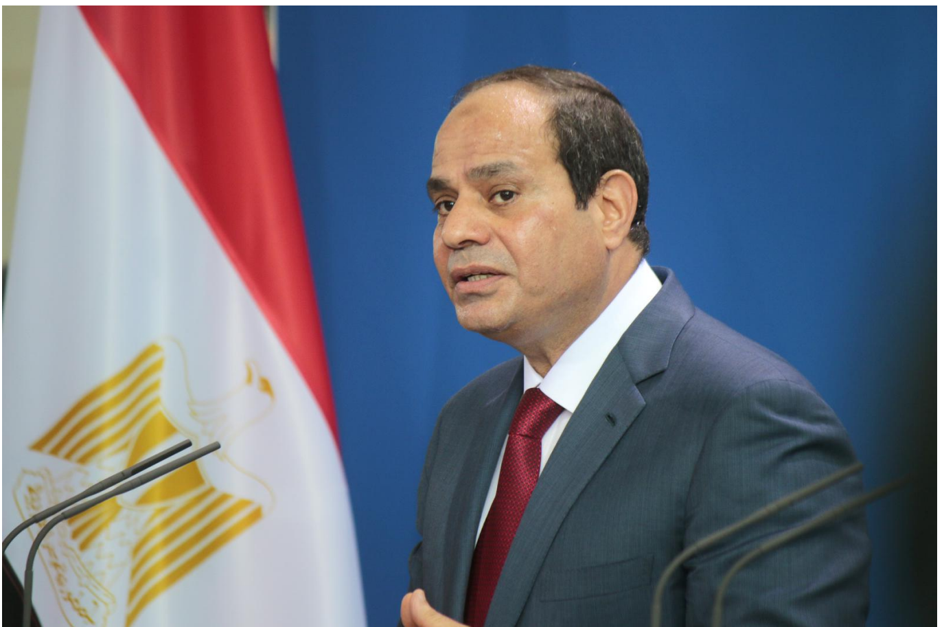
[Il Presidente egiziano Abdel-Fattah al-Sisi]

essenziale che coesistano per davvero una serie di criteri chiari e verificati: tra questi c'è il limite temporale garantito, l'applicabilità generale (che non penalizzi alcune categorie), che alla base ci siano norme legali (e che eventualmente possano subire delle modifiche), che le misure prese siano proporzionate alla situazione e che tutte le direttive rispettino prima di tutto la dignità umana. Tuttavia per molti Paesi la pandemia globale è stata una vera e propria manna dal cielo per attuare misure repressive spacciandole per "protezione della salute pubblica". Vediamone alcune.