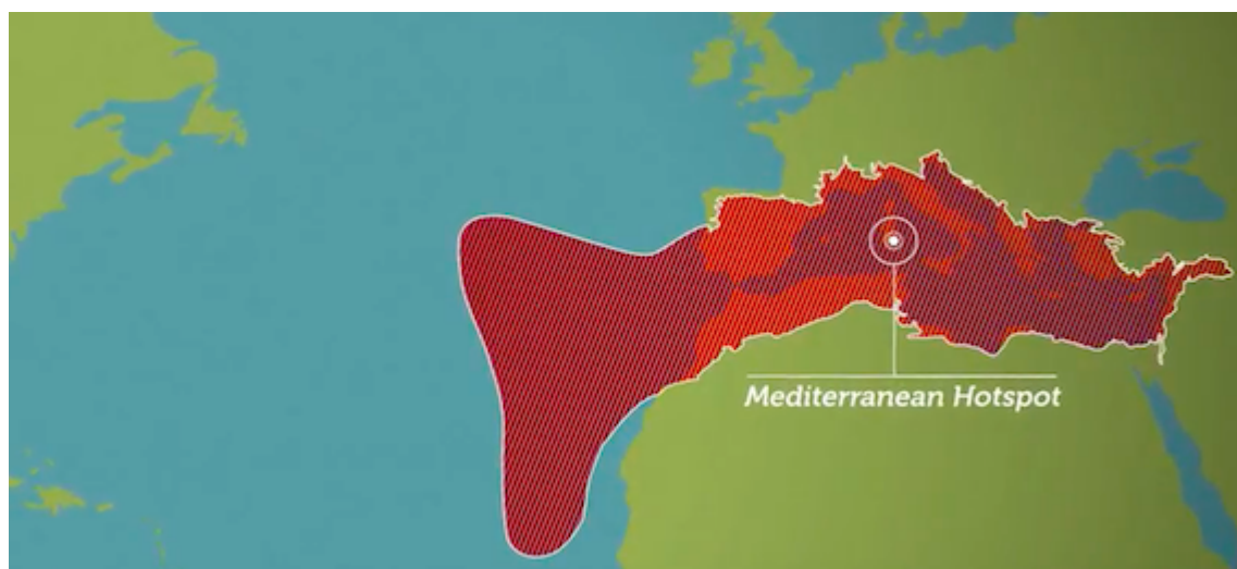
Mediterranean hotspot (IUCN, 2016)

Il Bacino del Mediterraneo non è solo una delle culle della civiltà. Qui, la storia dell'uomo si intreccia nel modo più intimo con le massime espressioni della natura. Una posizione geografica unica ed un'eterogeneità ambientale senza eguali , infatti, oltre ad aver favorito lo sviluppo della nostra cultura, hanno anche gettato le basi per l'evoluzione di una straordinaria biodiversità. Le ultime stime effettuate indicano, nel Mediterraneo, la presenza di circa 17.000 specie marine, le quali rappresentano dal 4 al 25% della diversità globale. Pur coprendo appena lo 0,82% della superficie terrestre, il Mediterraneo ospita circa il 7,5% delle specie mondiali. La ricchezza specifica, in rapporto all'area, è quindi circa 10 volte superiore alla media. Ancor più sorprendente se consideriamo che stiamo parlando in gran parte di endemismi, ovvero, specie che sono presenti solo nel nostro mare e sulle terre che lo circondano. Sono endemici il 44% dei pesci ed il 25% dei mammiferi, così come il 35% degli anfibi italiani e il 24% dei rettili iberici. Senza contare poi che l'ecoregione Mediterraneo ospita circa 25.000 specie vegetali, di cui più della metà esclusiva di quest'area.