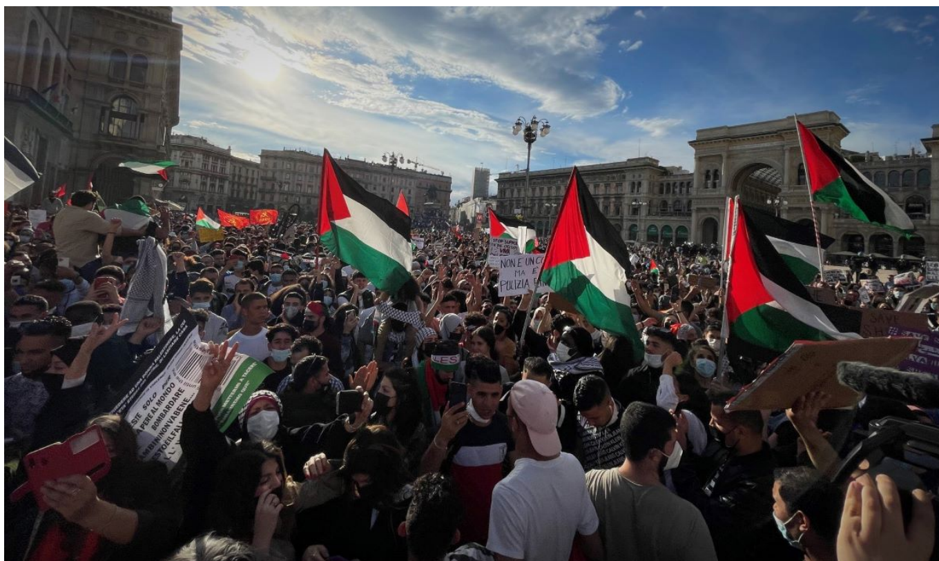
Milano, manifestazione contro la guerra a Gaza in piazza Duomo

Le piazze di tutta Italia si riempiono per la Palestina, ma i media non se ne accorgono