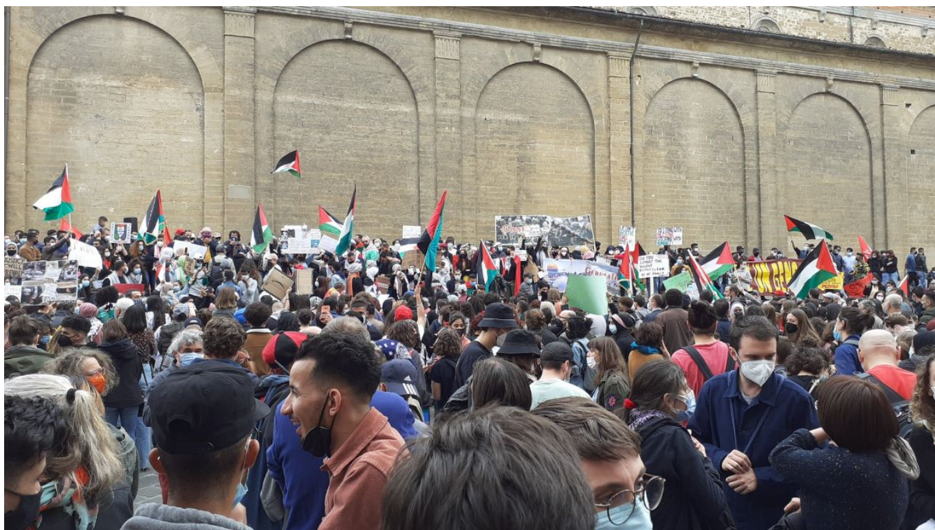
Manifestazione in solidarietà al popolo palestinese a Firenze

Le piazze di tutta Italia si riempiono per la Palestina, ma i media non se ne accorgono